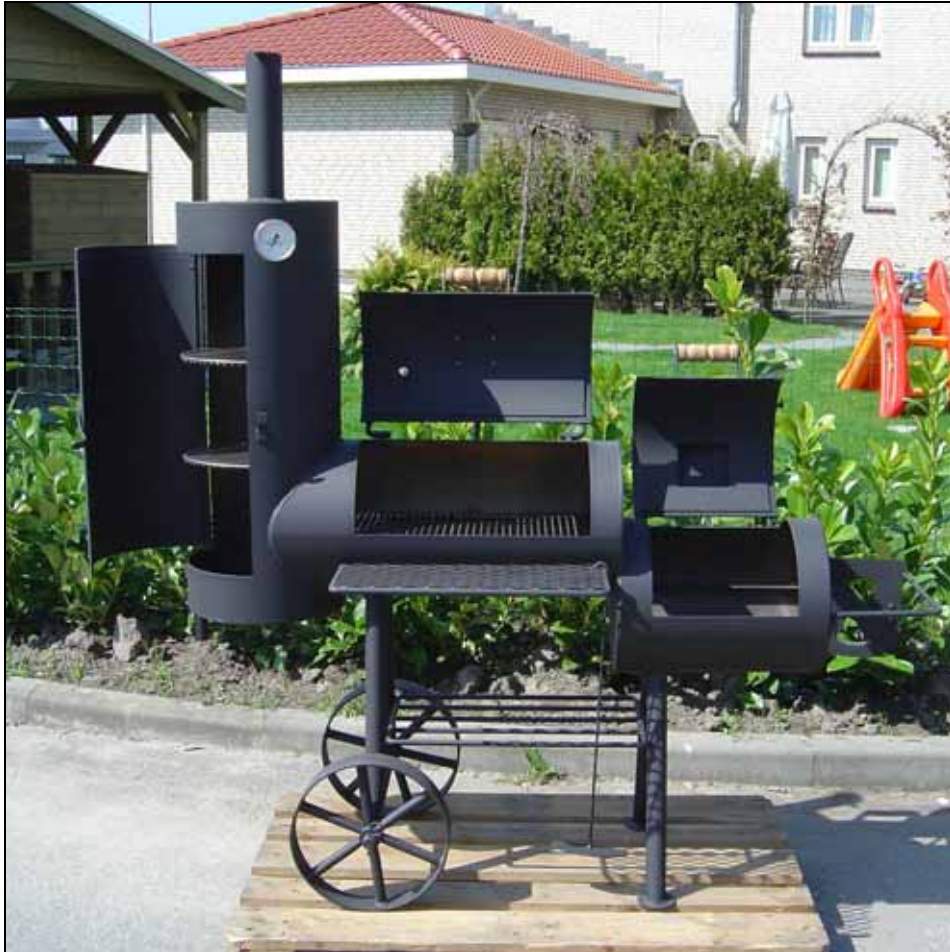
"THE LEGENDARY" BARBECUE SMOKER CHUCKWAGON

"The Legendary" Chuckwagons" zijn geschikt voor het bereiden van vlees, vis, groente, pizza en brood op de traditionele Amerikaanse manier van smoken. De keuze van het soort hout bepaald in belangrijke mate de smaak van de te bereiden gerechten. De "Legendary Chuckwagon" is gemaakt van ruim 5 mm voor de 16 inch en 4,2 mm voor de 13 inch dik zwart gepoedercoat staal en voorzien van grote metalen wielen. De Chuckwagon is dus verkrijgbaar in twee modellen 16 inch en 13 inch. Deze maat is de diameter van de verticale rookpijp. Voorzien van werkblad, twee thermometers en een opberggedeelte voor hout.